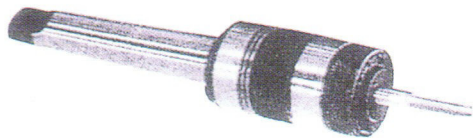
標準型 ( Standard Type )