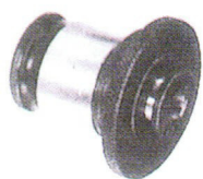
絲攻接頭 ( Tapping Adapter ) 標準型 ( standard )