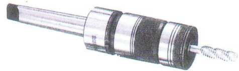
徑向浮動型 ( Radial Parallel Float Type )