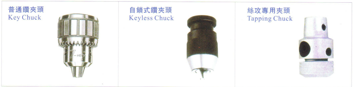
普通鑽夾頭 Key Chuck