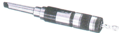
浮動伸縮雙功能型 ( Radial Parallel Float With Length Compensation Type )