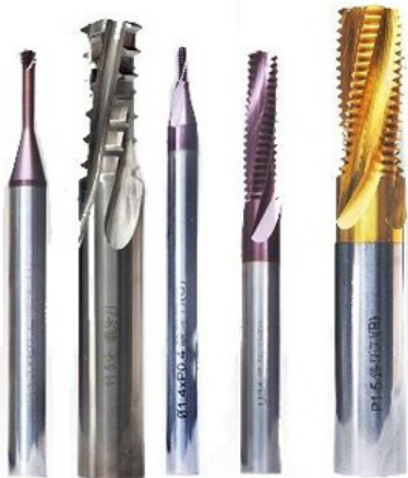
(THREAD MILLING CUTTER) ตัวล้างเกลียวใน