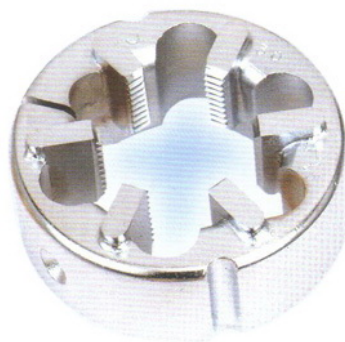
(ROUND DIE CARBIDE) ดายคาร์บาย ทำเกลียวนอก