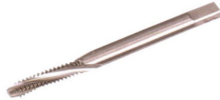
SFT (SPIRAL TAP CARBIDE) ต๊าปสไปโร คาร์บาย