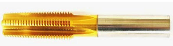
NUT TAP ต้ําปทำNUT ด้ามกลม ต้ํองต้อด้ามยาว (ถ้าด้ามมีเกลียวสั่งทำได้)