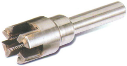
DIE WITH SHANK ดายมีด้าม